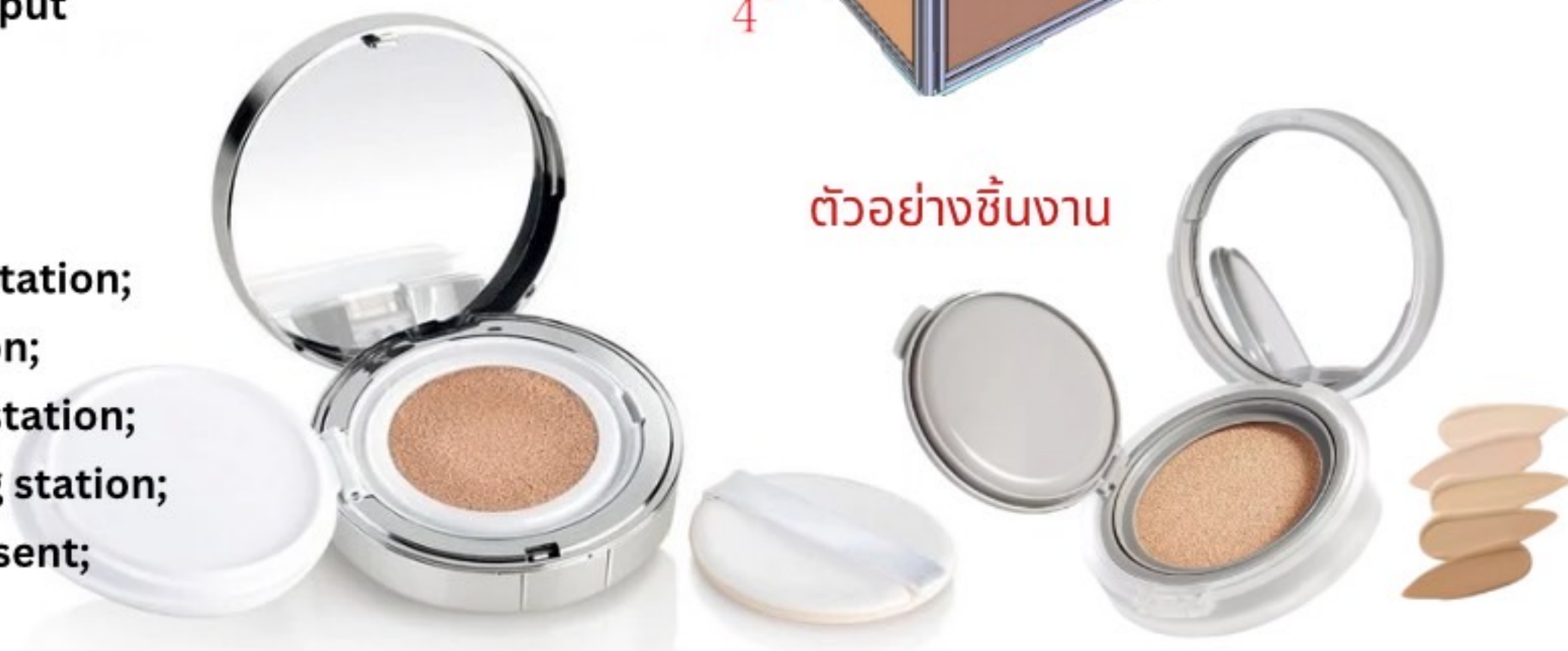
ตัวอย่างชิ้นงาน